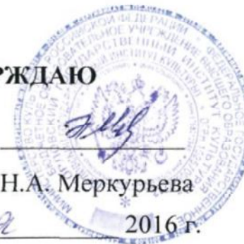
График учебного процесса обучающихся ФГБОУ ВО «Орловский государственный институт культуры»